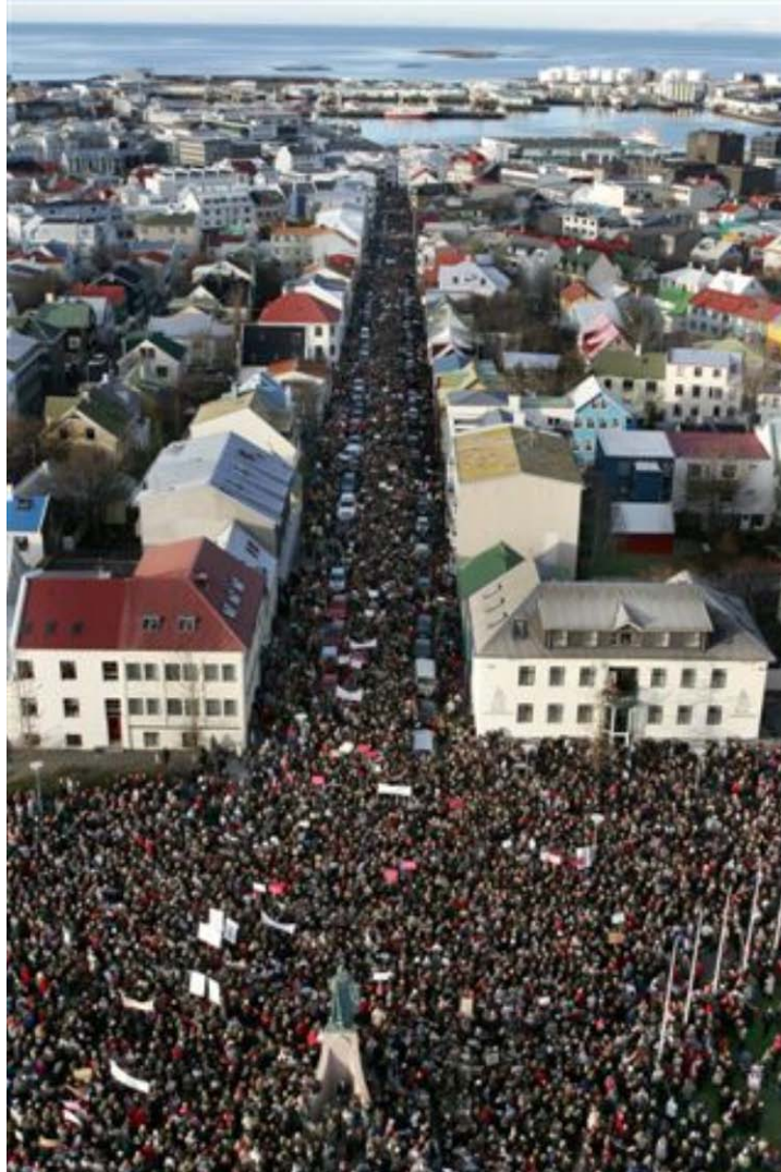
Fra kvinestreiken 2005