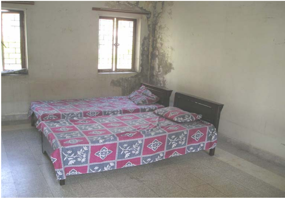
Fra et av soverommene på krisesenteret