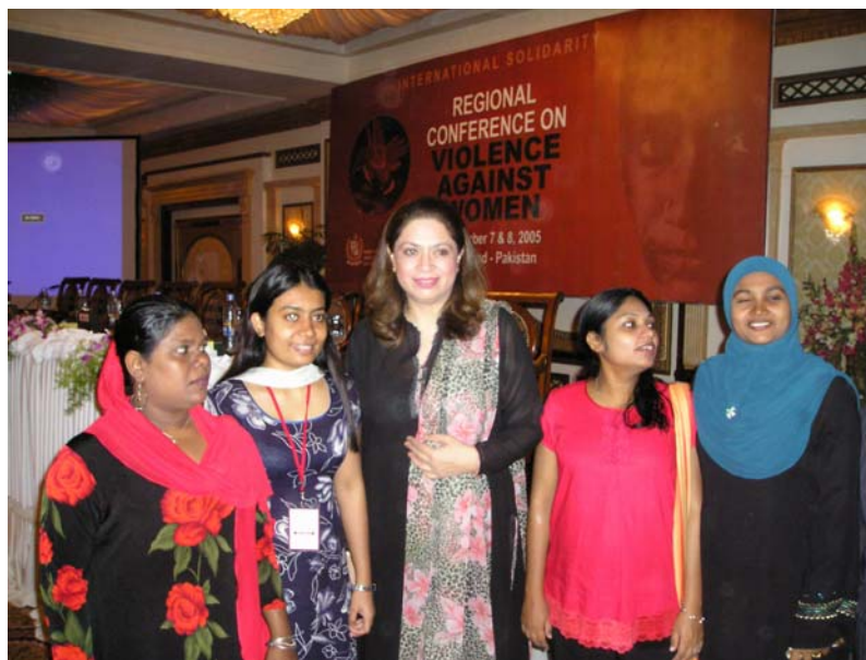
Nilofar Bakhtiar, statsråd i Womans Development Ministry og noen av kvinnene som deltok på konferansen